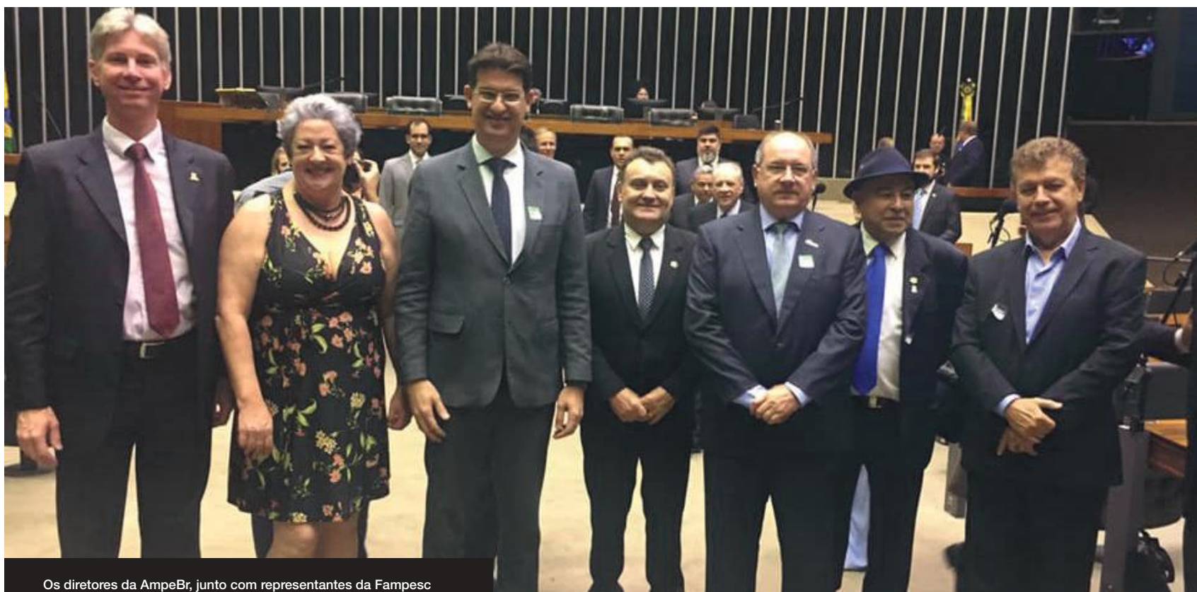
Os diretores da AmpeBr, junto com representantes da Fampesc e da Fecomércio/SC, na Câmara dos Deputados, em Brasília

Diretores da entidade participaram de demais reuniões e visitas a entidades na programação