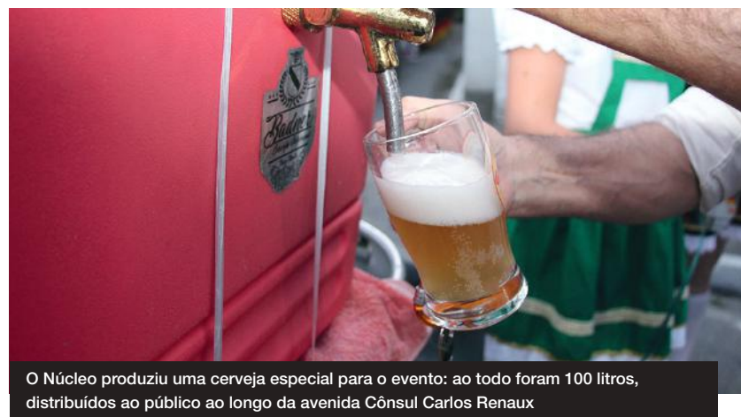
O Núcleo produziu uma cerveja especial para o evento: ao todo foram 100 litros, distribuídos ao público ao longo da avenida Cônsul Carlos Renaux

Além disso, em 2020 também inicia uma nova programação do Núcleo para os Cursos de Cervejeiro Iniciante, realizados ao longo do ano e que cada vez mais têm ganhado adeptos.