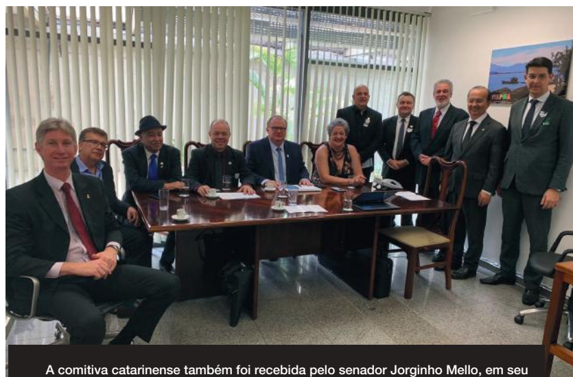
A comitiva catarinense também foi recebida pelo senador Jorginho Mello, em seu gabinete, em uma reunião junto ao presidente do Sebrae Nacional, Carlos Melles