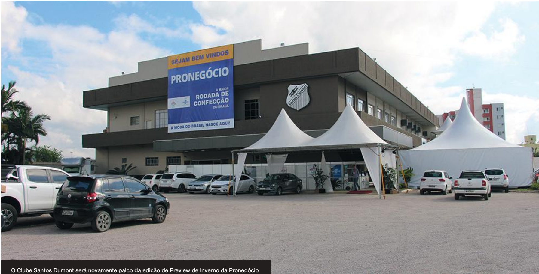
O Clube Santos Dumont será novamente palco da edição de Preview de Inverno da Pronegocio

na, que irão apresentar seus produtos do setor feminino, masculino e infantil.