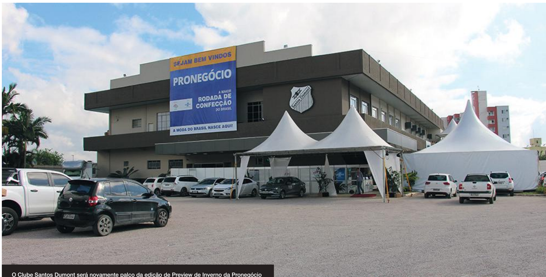
O Clube Santos Dumont será novamente palco da edição de Preview de Inverno da Pronegócios

na, que irão apresentar seus produtos do setor feminino, masculino e infantil.