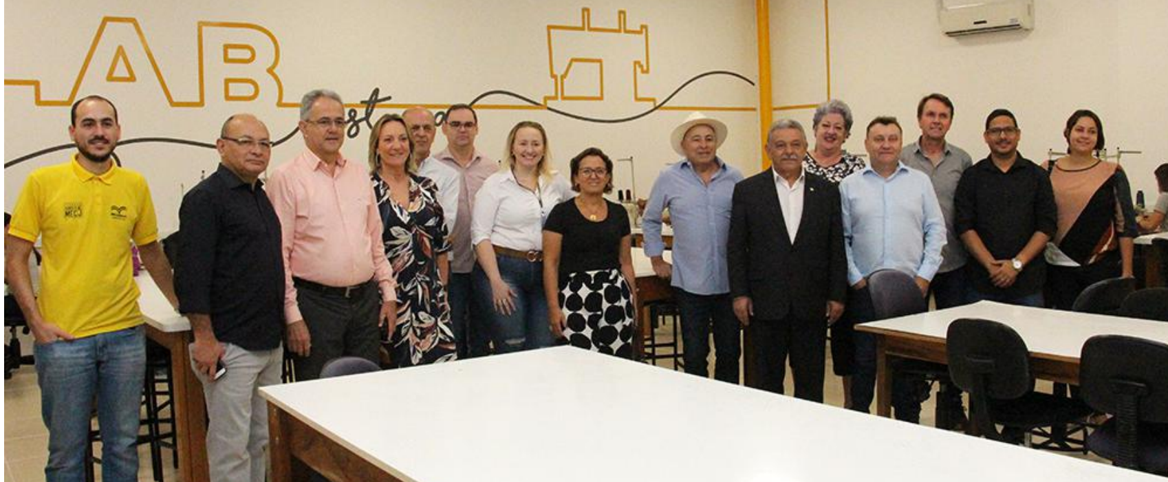
A comitiva conheceu de perto o trabalho realizado pela entidade brusquense, desde o case da Pronegocio até demais projetos, como o "Amor pela Costura"