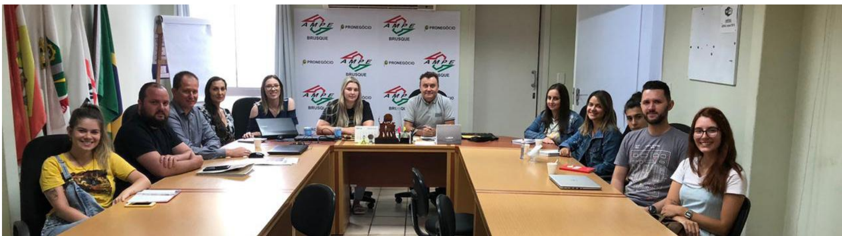
A parceria deve melhorar a comunicação e promoção das ações da AmpeBr com seus associados, parceiros e clientes

De acordo com dados da Federação das Indústrias de Santa Catarina (Fiesc), o setor têxtil de Santa Catarina possui 159.591 empregos diretos, onde 37% da mão de obra é masculina e 63% feminina. Além disso, o setor representa 21% de empregabilidade no Estado. Em relação aos polos têxteis, a região de Blumenau possui um índice de empregabilidade de 13%, seguida de Brusque com 10% do índice, e de Jaraguá do Sul, com 8%. Somente as três regiões representam 31% da empregabilidade do segmento no Estado.