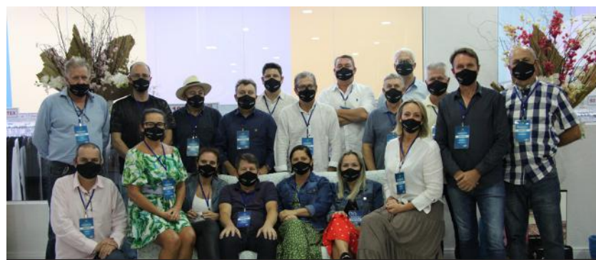
A diretoria da AmpeBr reunida, comemorando o sucesso da 54ª Pronegócio, no último dia do evento presencial