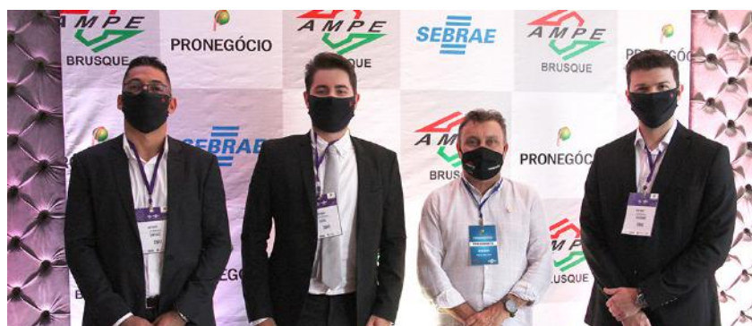
Advogados e consultores da Stoinski Advocacia, de Jaraguá do Sul também visitaram a 54ª Pronegócio