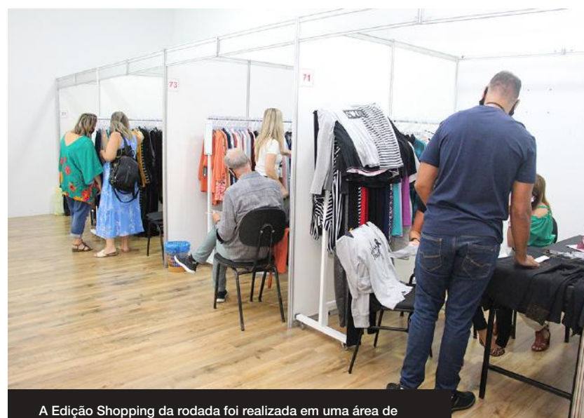
A Edição Shopping da rodada foi realizada em uma área de 2 mil m 2 , dentro do centro comercial River Mall, em Brusque

Estamos bem servidos de mercadoria aqui na rodada, o leque de produtos oferecidos foi muito bom, as fábricas têm bastante qualidade, e o diferencial é a diversidade dos produtos. Alcançamos nosso objetivo, que é o produto final, que sabemos que agrada o consumi-