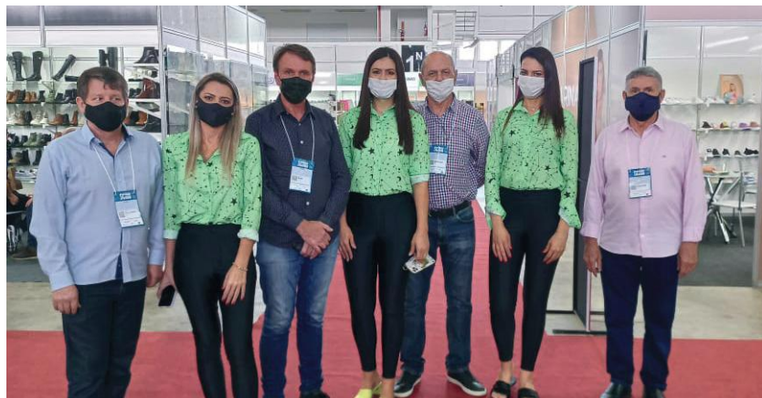
Os diretores da AmpeBr com as representantes do Sindicato das Indústrias de Calçados de São João Batista (Sincasjb), responsável pela organização do evento