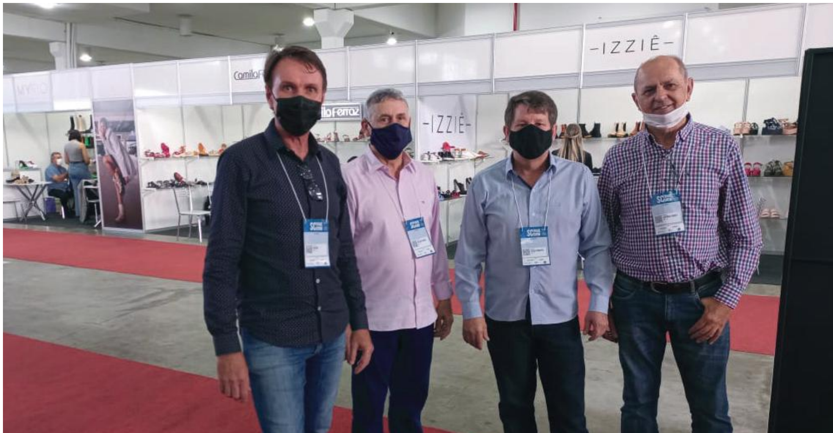
Os diretores da AmpeBr conferiram as tendências e novidades do setor, bem como a estrutura do evento, que voltou a ser realizado de forma presencial