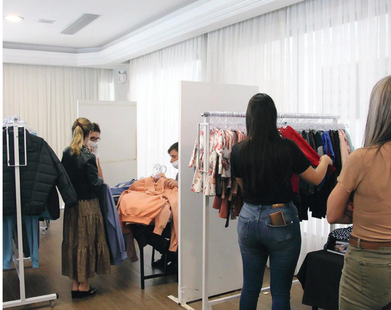
Nesta edição, a Preview foi organizada em formato diferenciado, de mini rodadas, por meio de agendamentos direcionados para as negociações

Segundo Sandra, um dos diferenciais do evento foi o showroom montado no local, com a exposição dos produtos