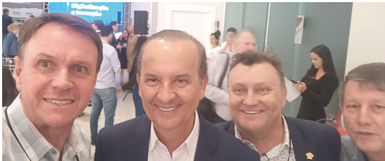
Os diretores da AmpeBr no Seminário de Apoio e Desenvolvimento das Micro e Pequenas Empresas, com o governador do Estado, Jorginho Mello

O encontro teve como objetivo envolver e mobilizar os setores empresariais nacionais para debater as disposições do Projeto de Lei Complementar nº 125, de 2023, que sugere mudanças no Estatuto da Micro e Pequena Empresa. Durante o evento, temas como o fortalecimento da categoria; financiamentos com baixos juros; aumento de teto de faturamento para as micros e pequenas empresas; e