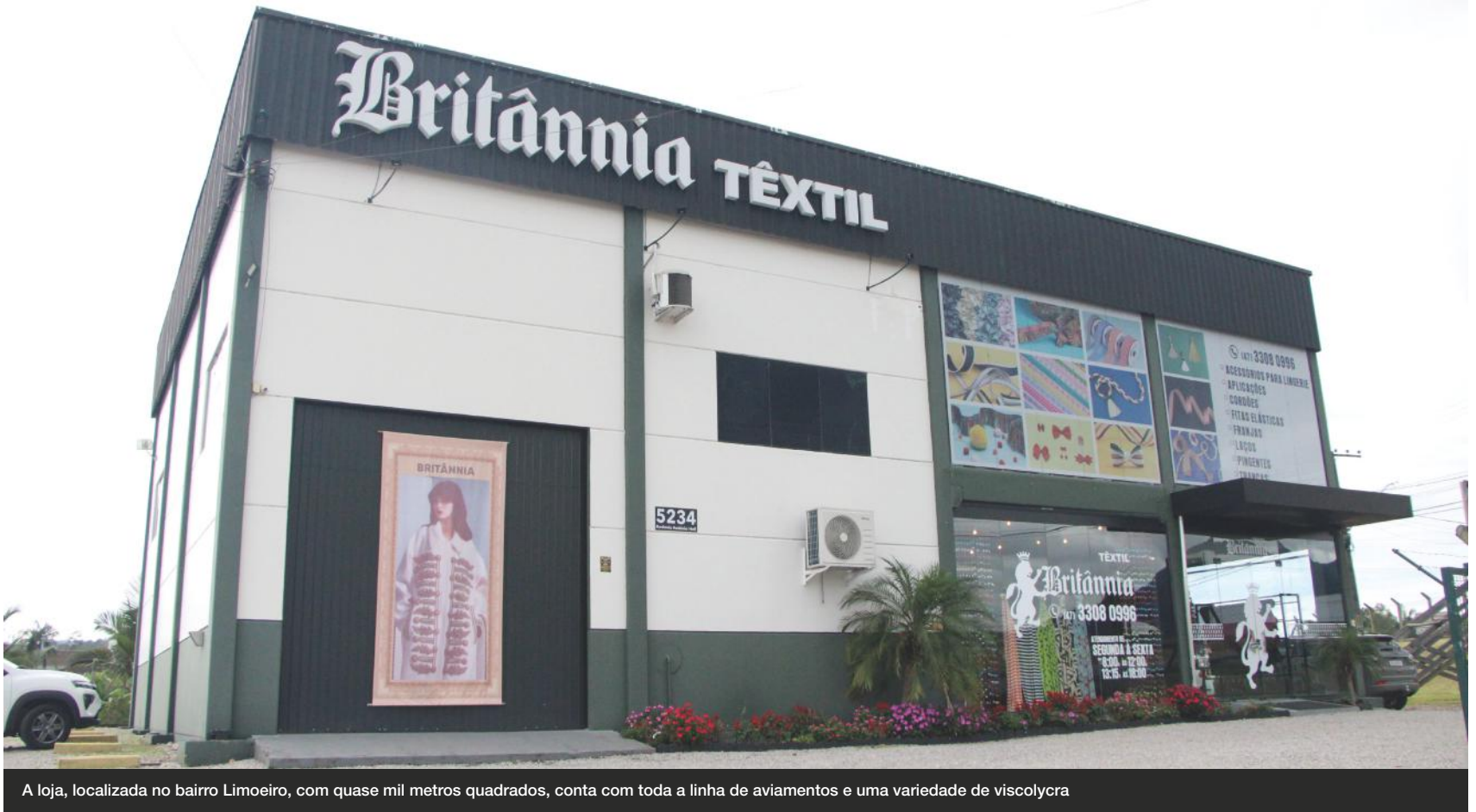
A loja, localizada no bairro Limoeiro, com quase mil metros quadrados, conta com toda a linha de aviamentos e uma variedade de viscolycra