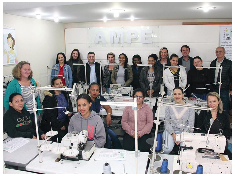
O projeto 'Amor pela Costura' tem duração de três meses e inicialmente irá formar 60 alunas, divididas em quatro turmas do curso