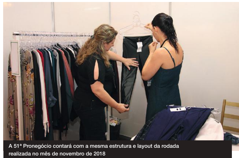
A 51ª Pronegócio contará com a mesma estrutura e layout da rodada realizada no mês de novembro de 2018