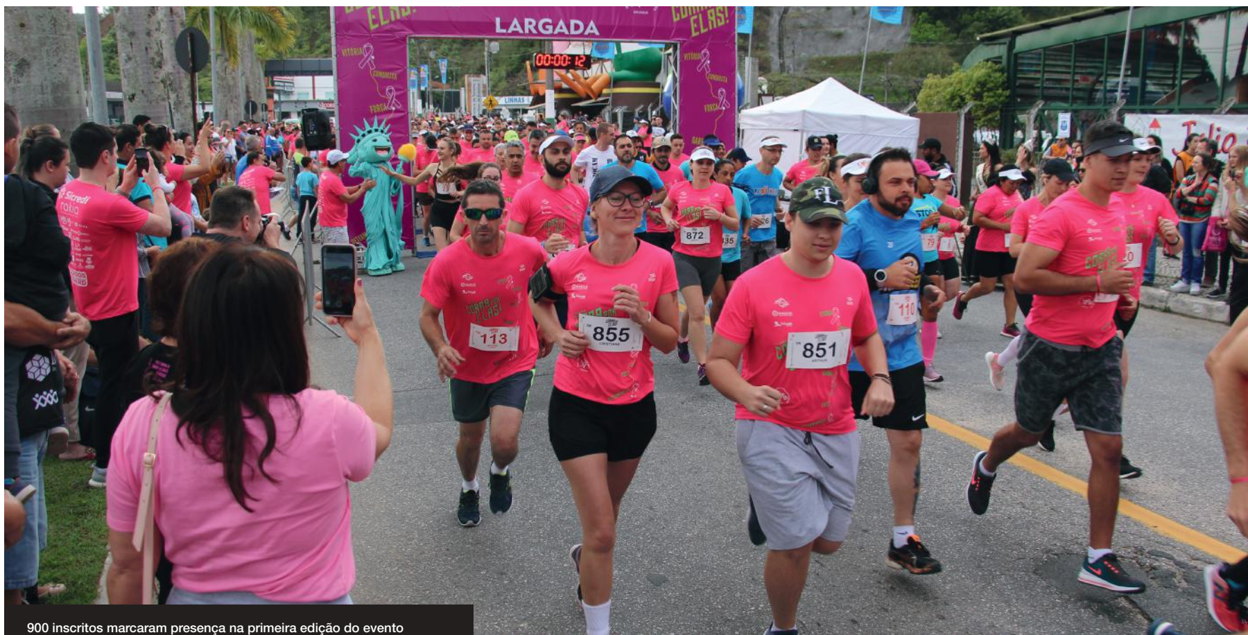
900 inscritos marcaram presença na primeira edição do evento