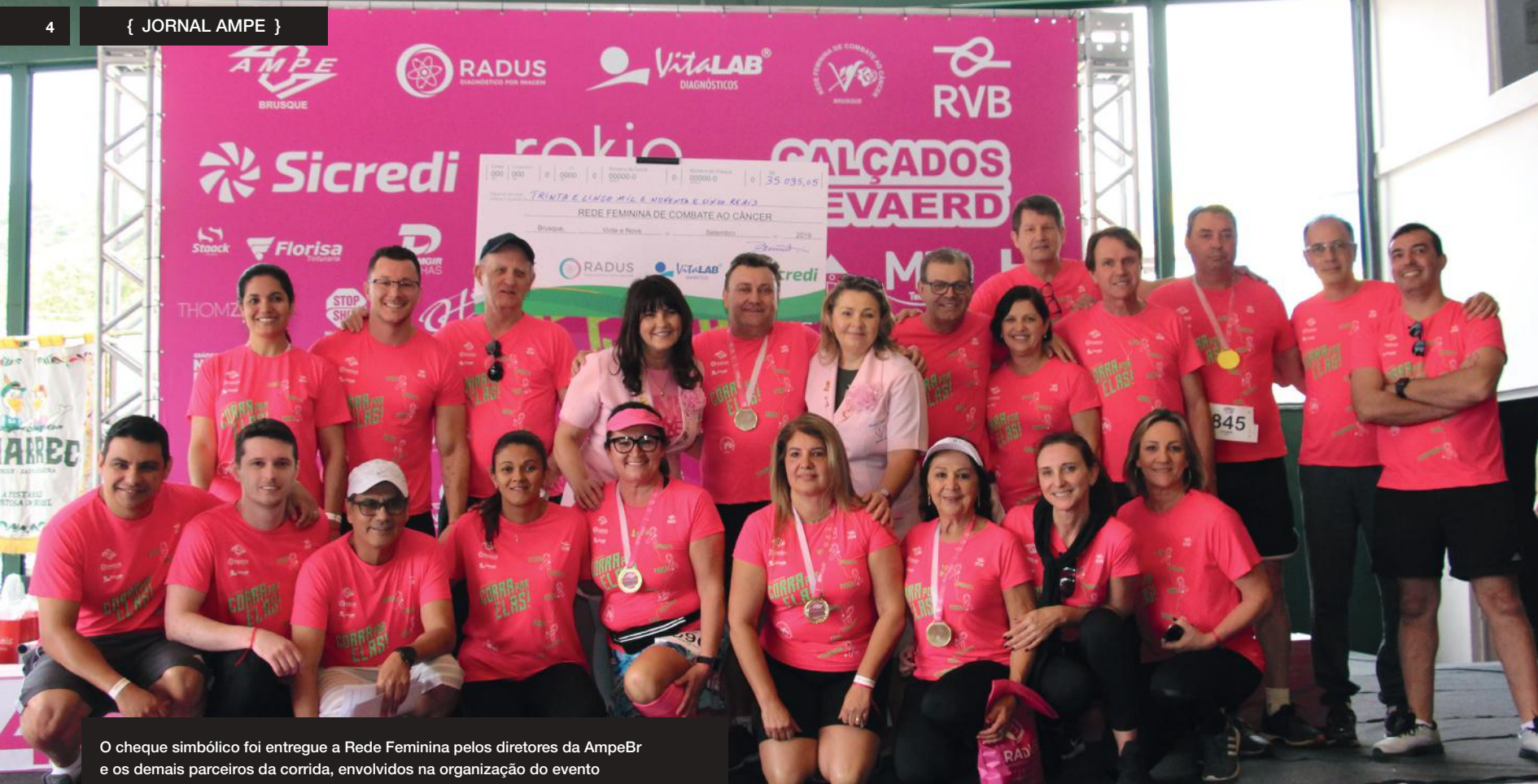
O cheque simbólico foi entregue a Rede Feminina pelos diretores da AmpeBr e os demais parceiros da corrida, envolvidos na organização do evento