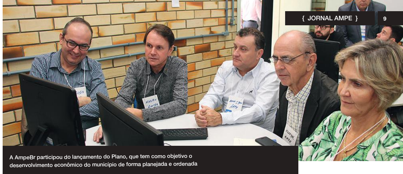
A AmpeBr participou do lançamento do Plano, que tem como objetivo o desenvolvimento econômico do município de forma planejada e ordenada

Ao longo do evento, foram apresentadas as etapas de realização do Pedem em Brusque, bem como um panorama com números da cidade em diversas áreas, como taxa de crescimento, índice de emprego e desemprego, número de empresas, ranking de crescimento, concentração dos empregos, fatores facilitadores e restritivos, além das dez principais atividades econômicas. Os dados apresentados foram elaborados